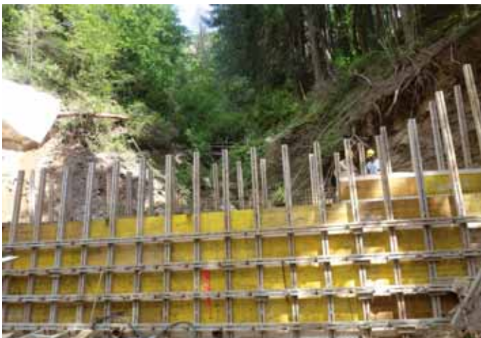
Die Staumauer wird hinterfüllt und soll die seitlichen Hänge sichern

Die WLW arbeitet seit vielen Jahren fast durchgehend in unserer Gemeinde. Nach dem Lieserhofer Bach steht nunmehr die Verbauung in Tangern mit Plonerbach und Tangerner Bach mit Entlastungskanal vor der Fertigstellung. Derzeit wird beim Plonerbach ca. 300 Meter vor dem See ein Konsolidierungsbecken errichtet.