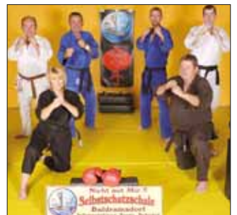
Das Trainer- und Ausbildungsteam freut sich auf Euch!