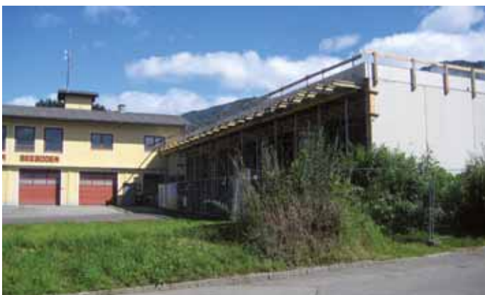
Die Rohbauarbeiten beim neuen FF-Haus sind bald fertig gestellt!

Der Um- und Neubau des FF-Hauses in Seeboden geht gut voran. Der Großteil der Arbeiten wurde bereits vergeben und aus heutiger Sicht werden wir den finanziellen Rahmen einhalten können. Der Architekt, die Firmen und die Feuerwehrkameraden bemühen sich sehr um einen reibungslosen Ablauf und alle sind gut miteinander abgestimmt. Im Sinne unserer Sicherheit konnten wir im Einklang mit den Nachbarn den Sommer über durcharbeiten.