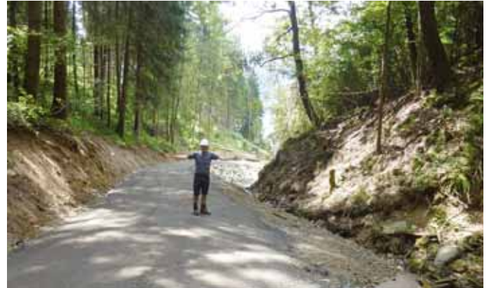
Polier Hans Jehsner (WLW) zeigt die Position des künftigen Rückhaltebeckens

Im Juli 2017 wird dieses Projekt mit der Errichtung eines Rückhaltebeckens ca. 200 Meter vor dem See (und der Bundesstraße) abgeschlossen. Die Gesamtkosten werden 3,5 Mio. Euro ausmachen, wovon die Gemeinde Seeboden am M. S. ca. 700.000 Euro zu tragen hat.