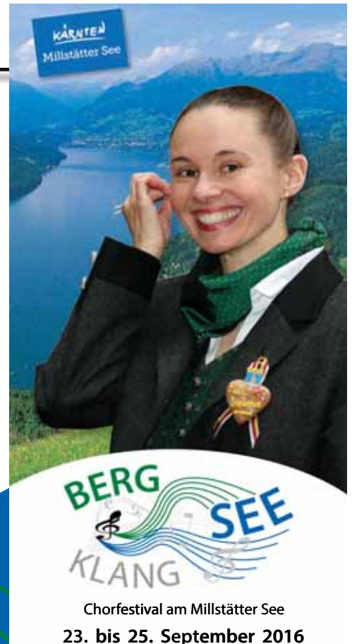
Chorfestival am Millstätter See 23. bis 25. September 2016

Datum: 25.09.2016 Uhrzeit: 11:00 Uhr Veranstaltungsort: Dorfplatz Tangern Umrahmung des ökumenischen Erntedankgottesdienstes in Tangern // Dorffest in Tangern // offizielle Verabschiedung der Gastchöre