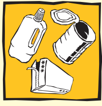
Gelber Sack / Gelbe Tonne