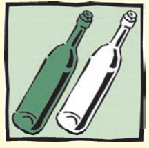
Bunt- bzw. Weißglasbehälter