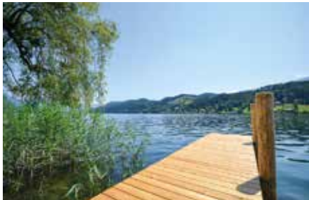
SEEBODEN 1080 / 3110