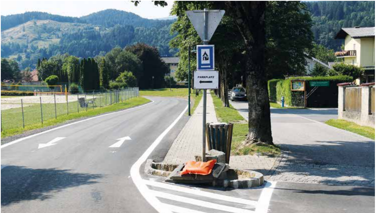
Möglichst kurze Zu- und Abfahrmöglichkeiten reduzieren die KFZ-Kilometer im Seezentrum – dafür weniger Geschwindigkeit!

Das naheliegende Konzept sucht das Gegenteil: möglichst wenig Kfz-Kilometer im Seezentrum und dazu mit reduzierter Geschwindigkeit! Die Zufahrt über die Seeallee (bis Objekt Dr. Strießnig) wurde bereits realisiert und stellt nun die kürzeste Zufahrt zu den Parkplätzen im Seezentrum dar. Damit werden zufahrende Autos von der Seestraße in die Seeallee verlagert. Das wird in Zukunft aber im Sinne von „gerechter Lastverteilung des Verkehrsaufkommens“ kompensiert, weil einige Abfahrende von den Parkplätzen künftig den Kreisverkehr bei der Seestraße suchen werden. Wir sind mit den Zuständigen des Landes und der BH Spittal in Verhandlungen, um den Bereich „Begegnungszone“ nicht nur in der Promenade zum See, sondern möglichst im ganzen Bereich des Seezentrums verordnen zu dürfen.