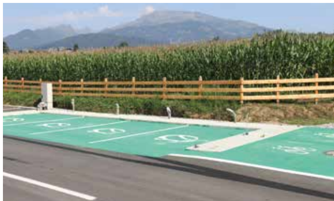
Keine Schnell-Ladestation, denn diese wollen wir aus verkehrstechnischen Gründen außerhalb des Ortszentrums; aber „gemütliches Laden“ während Spaziergang oder Lokalbesuch etc.