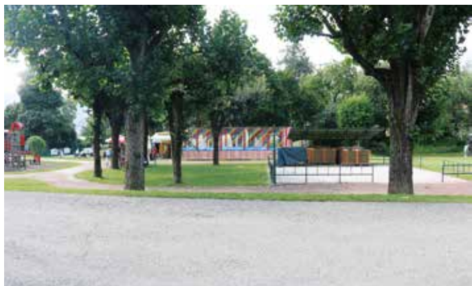
Seit 20 Jahren eine wichtige Einrichtung in Seeboden – ein neuer Standort mit dann versenktem Unterbau soll die Optik verbessern

Nachdem für die Neugestaltung des Seezentrums Ersatzparkplätze entlang der Seeparkstraße geschaffen werden konnten, können wir eine Parkbucht „opfern“ und als Promenade Richtung See zur Verfügung stellen. Natürlich muss die Trampolinanlage einen neuen Standort bekommen, da sie sich derzeit genau in der Sicht-Achse zum See befindet.