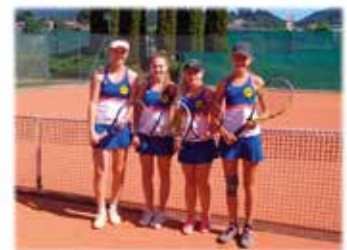
Unser junges Damenteam in der LLA

Aber auch die anderen zwölf Mannschaften haben die Meisterschaft zum größten Teil wirklich erfolgreich abgeschlossen. Mit diesen Erfolgen darf sich die SG Millstätter See wohl zu Recht als einer der stärksten Tennisvereine in Kärnten rühmen!