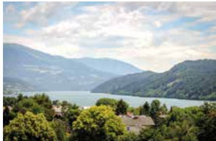
SEEBODEN 1080 / 3104

Leben am Wasser mit Top-Infrastruktur. Entspannen auf der Seeterrasse mit Bootssteg direkt am Millstätter See. Wfl. ca. 370 m 2 , Gfl. ca. 1.316 m 2 HWB: 96 kWh/m 2 a, fGEE: 1,17 Kaufpreis € 3,3 Mio. Hr. Regger Tel. +43 4762 42330