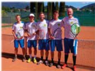
Erfolgreiche Herren SG Millstättersee 1

Sowohl unsere Damen als auch die Herren konnten ihre Gruppen im Grunddurchgang souverän gewinnen und zogen überraschend ins Obere Play-Off ein. Saisonhöhepunkt waren somit die beiden Semifinals , die am 23. Juni zeitgleich auf unserer Anlage in Seeboden gespielt wurden.