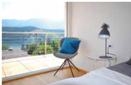
SEEBODEN 1080 / 3112

Offene und helle Raumgestaltung; traumhafter Garten, absolute Ruhelage; sonnenverwöhnt. Wfl. ca. 371 m 2 , Gfl. ca. 1.318 m 2 HWB: 147,9 kWh/m 2 a, fGEE: 1,56 Kaufpreis € 490.000,- Hr. Regger Tel. +43 4762 42330