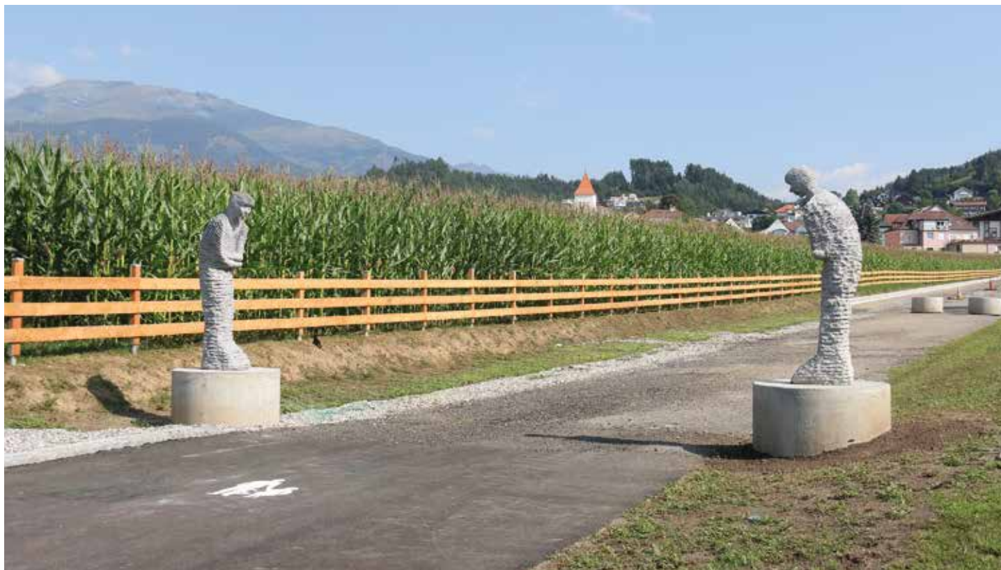
Die beiden Herren kommen Ihnen bekannt vor? Richtig! Sie versahen als Leihgabe jahrelang „Dienst“ in Millstatt

Seeboden entwickelt sich; Einwohner und Arbeitsplätze nehmen zu. Ein attraktiver Lebens- und Wirtschaftsraum muss auch dem Aspekt „Kunst“ entsprechenden Raum geben. Die beiden Figuren aus einem früheren Krastal-Symposium konnte die Marktgemeinde Seeboden am Millstätter See mit kräftiger Hilfe der Raika Seeboden ankaufen. Vielen Dank dafür! Eventuell stehen die „Empfangsherren“ sogar schon auf ihrem endgültigen Platz. Aber auch das besprechen wir im Herbst öffentlich.