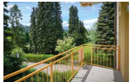
MILLSTATT 1080 / 2893

Fabelhafter See- und Bergblick! Hochwertige und moderne Ausstattung, helle Räume. Barrierefrei! Erstbezug. Wfl. ca. 100 m 2 , Terrasse. ca. 26 m 2 HWB: 39 kWh/m 2 a, fGEE: 0,82 Kaufpreis € 448.000,- Fr. Fortschegger Tel. +43 664 881 79 096