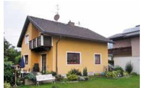
SPITTAL / DRAU 1080 / 3115

Idyllischer Garten, wunderschöner Seeblick, Sonnenterrassen. Modernes Inneres, Top-Lage! Wfl. ca. 150 m 2 , Gfl. ca. 3.000 m 2 HWB: 155 kWh/m 2 a, fGEE: 3,51 Kaufpreis € 685.000,- Hr. Hinteregger Tel. +43 664 881 79 087