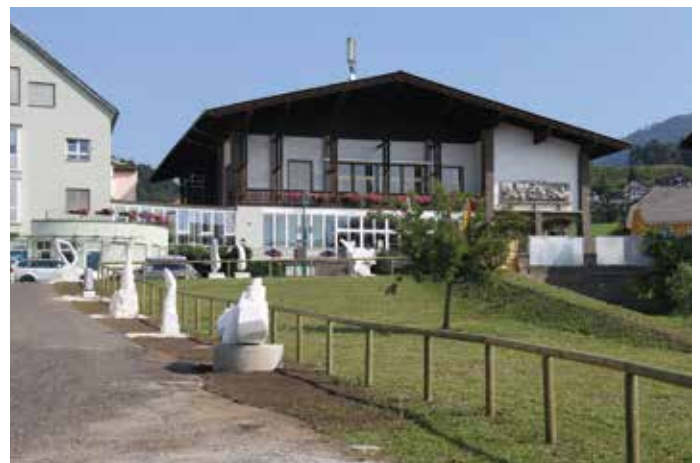
Das Kulturhaus rückt ins Bild

Mit dem Abriss der „Boxerhalle“ und des Wenzel-Hauses wurde das Kulturhaus freigestellt. Viele finden dieses Gebäude hässlich; wir glauben hingegen, dass wir uns ein Bauen in dieser Qualität heute kaum leisten könnten und letztlich der Stil der 60er und 70er-Jahre als Zeitdokument noch zu Ehren kommen wird. Jedenfalls wollen wir das Gebäude in seiner Anmutung erhalten, den nachträglichen Zubau (Verbindungsgang) „verträglicher“ machen, den Prof.-Otto-Eder-Platz neu gestalten und über die Hauptstraße auf das Areal Wenzel vergrößern. Letztlich soll eine „Platzgestaltung“ für eine Verlangsamung des Verkehrs an der Hauptstraße sorgen und damit die Querung dieser Durchzugsstraße angenehmer und sicherer werden.