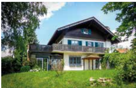
SEEBODEN 1080 / 3043

Gemütliches Einfamilienhaus, traumhaft angelegter Garten, sehr gepflegt, ideale Lage, Top-Infrastruktur. Ab Oktober 2019. Wfl. ca. 120 m 2 , Gfl. ca. 580 m 2 HWB: in Arbeit Kaufpreis € 249.000,- Fr. Frühauf Tel. +43 664 881 79 083