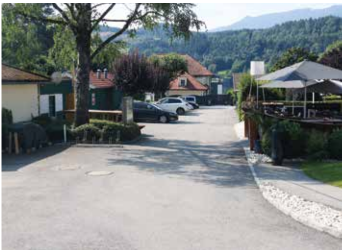
Die Festwiese ist künftig völlig anders zu denken – aber es gibt unglaubliches Potential!

Das naheliegende Konzept sucht das Gegenteil: möglichst wenig Kfz-Kilometer im Seezentrum und dazu mit reduzierter Geschwindigkeit! Die Zufahrt über die Seeallee (bis Objekt Dr. Strießnig) wurde bereits realisiert und stellt nun die kürzeste Zufahrt zu den Parkplätzen im Seezentrum dar. Damit werden zufahrende Autos von der Seestraße in die Seeallee verlagert. Das wird in Zukunft aber im Sinne von „gerechter Lastverteilung des Verkehrsaufkommens“ kompensiert, weil einige Abfahrende von den Parkplätzen künftig den Kreisverkehr bei der Seestraße suchen werden. Wir sind mit den Zuständigen des Landes und der BH Spittal in Verhandlungen, um den Bereich „Begegnungszone“ nicht nur in der Promenade zum See, sondern möglichst im ganzen Bereich des Seezentrums verordnen zu dürfen.